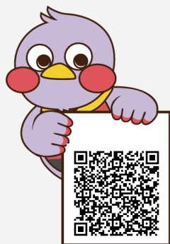
埼玉県マスコット 「さいたまっち」

申請に関することは、在籍する学校へお問い合わせください。 当制度をより詳しく知りたい方は学事課HPをご参照ください。